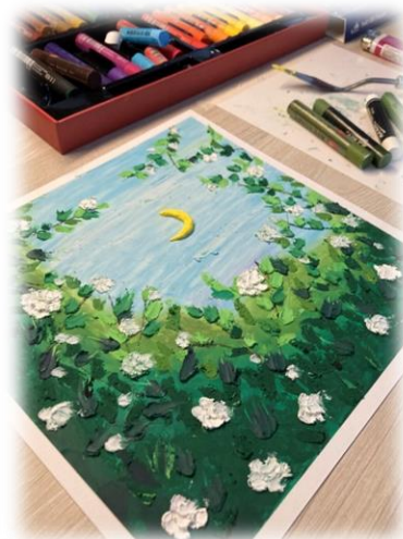
油畫棒創作 作品示範